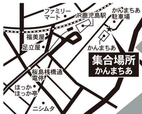
【集場所ご案内マップ】